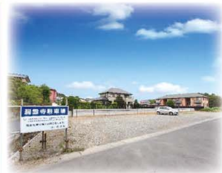
ゆとりある駐車場