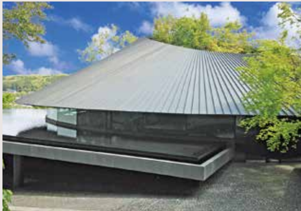
水盤に映る狭山の四季、管理休憩棟