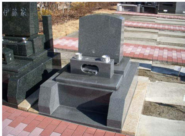
1.5㎡ゆとり区画（CFグレー）